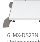
6. MX-DS23N Unterschrank