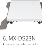
6. MX-DS23N Unterschrank