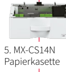
5. MX-CS14N Papierkassette