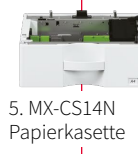
5. MX-CS14N Papierkassette