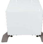
4. MX-DS22N Unterschrank