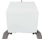
4. MX-DS22N Unterschrank