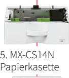
5. MX-CS14N Papierkassette